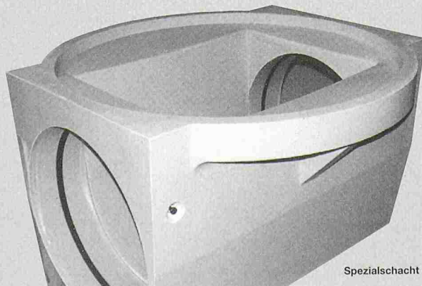
Spezialschacht für den Tunnelbau

Polycryl fabriziert Bauelemente aus Polymerbeton. Und dies tun wir ganz nach Ihren Wünschen und Ansprüchen. In der Realisation objektspezifischer Individuallösungen liegt unsere besondere Stärke.