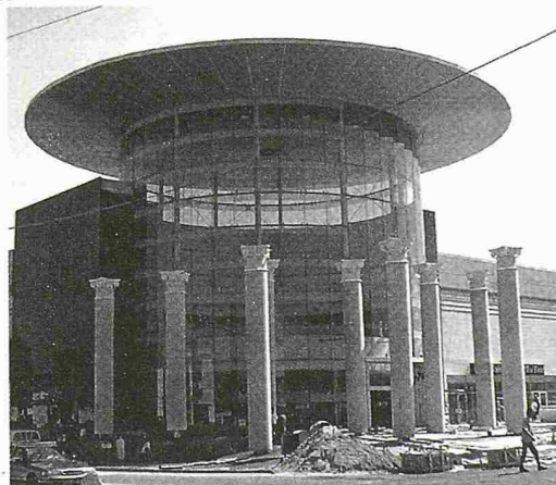
RYTZ Industriebau AG Hauptstr. 1, 4455 Zunzgen 061/975 81 81 Internet: www.rytz.ch Email: info@rytz.ch