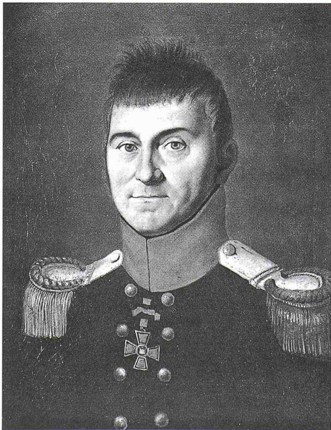
1 Johann Gottfried Tulla, 1770–1828

1794 zog Tulla weiter, um einige laufende Korrektionsarbeiten an grossen Flüssen kennenzulernen. Sein Studienprogramm wurde deswegen aber nicht eingengt, sondern erhielt die zusätzlichen Stichworte: «Zivilbaukunst» mit Baustatik und Baustoffkunde, Vermessung und Planzeichnen, «Salzwerkskunde» und «Hydrotechnik» (Wasserbau) nach «ihrem ganzen Umfang», insbesondere mit Schleusen (Wehren). Zuerst verbrachte er zwei Monate in Düsseldorf bei Karl Friedrich von