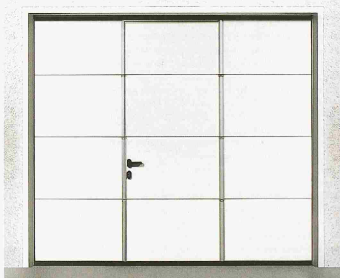
Garagentor mit Schlupftür der Hörmann AG