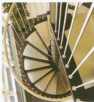
Schwarzer Lack, Stahl und Holz, von der Keller Treppenbau AG zur eleganten Spindeltreppe vereint