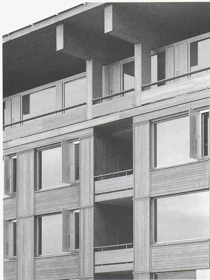
Das neue Lehrgebäude der SH-Holz sorgte weit über die Grenzen der Schweiz für Aufsehen. Für die Teilnehmer des Nachdiplomstudiums Holz ist es ein idealer Ort, um sich mit den Möglichkeiten des Holzhausbaus auseinanderzusetzen

Nächster Studienbeginn: 23. Oktober 2000. Weitere Auskünfte: Urs Luedi dipl. Architekt ETH/SIA, Leiter NDS-Holzbau, Abteilung FH NDS-Holzbau, Solothurnstrasse 102, 2504 Biel, Telefon 032 344 03 72, Fax 032 344 03 90, office@swood.bfh.ch, www.swood.bfh.ch