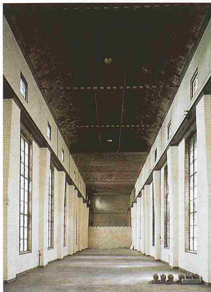
Die Hauptausstellungsfläche in der ehemaligen Maschinenhalle umfasst rund 700 m 2 (links). Die ehemalige Schaltwarte (rechts) wird für Empfänge, Konferenzen und andere Veranstaltungen genutzt

Das Vitra Design Museum Berlin befindet sich an der Kopenhagener Strasse 58/Ecke Sonnenburger Strasse. Die Eröffnungsausstellung über Verner Panton läuft vom 1. Juli bis zum 17. Oktober, Öffnungszeiten sind Dienstag bis Sonntag, 10 bis 20 Uhr.