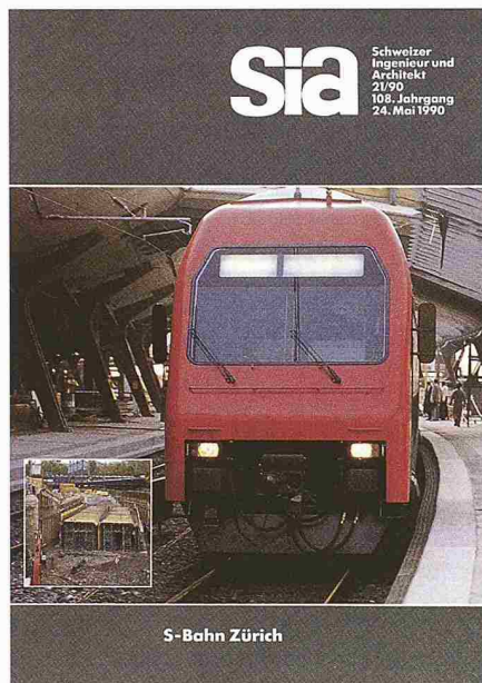
Zur Eröffnung der S-Bahn Zürich erschienene SI+A-Ausgabe 21 vom 24. Mai 1990 (vergriffen)

Wohlgelaunt dürfen die Verantwortlichen bei den SBB, beim Zürcher Verkehrsverbund und beim Kanton das Jubiläum eines erfolgreichen Werkes begehen. Die S-Bahn Zürich ist vor zehn Jahren in Betrieb genommen worden – und für uns Bürger nicht mehr wegzudenken. Man erinnere sich: Nicht nur dass aus grauen Vorortsstrecken urban anmutende durchnummerierte S-Bahn-Linien wurden. Neue Tunnels unter der Stadt liessen die Transportzeiten schmelzen, das dicht besiedelte Glatttal und die zweitgrösste Stadt im Kanton, Winterthur, rückten gleichsam näher an Zürich. Vorbei die Zeiten, als für die Bewohner des Sihltals die Stadtfahrt am Quartierbahnhof Selnau abrupt endete. Nun begannen die Doppelstockzüge zu rollen – im Halbstunden-, ja im Viertelstunden- und 10-Minuten-Takt. Der Hauptbahnhof erhielt ein zunächst labyrinthisch anmutendes unterirdisches Leben, und am Stadelhofen entstand ein Knotenpunkt, der bald die Titelseiten der Architekturzeitschriften in aller Welt zieren sollte. Kantonsfremde erkannte man daran, dass sie an den Haltestellen verzweifelt das Zonen-Tarifsystem zu durchschauen versuchten, während Schlaue rasch die Vorteile des Tarifverbunds zu nutzen lernten. Die Stadt Zürich wurde bahnmässig, was ihre Bewohner so oft beschwören: Weltstädtisch nämlich muten die Massen an, die sich nun zur Stosszeit auf den Perrons drängen, sich aus den alle paar Minuten heranschiessenden Züge ergiessen oder sie entern.