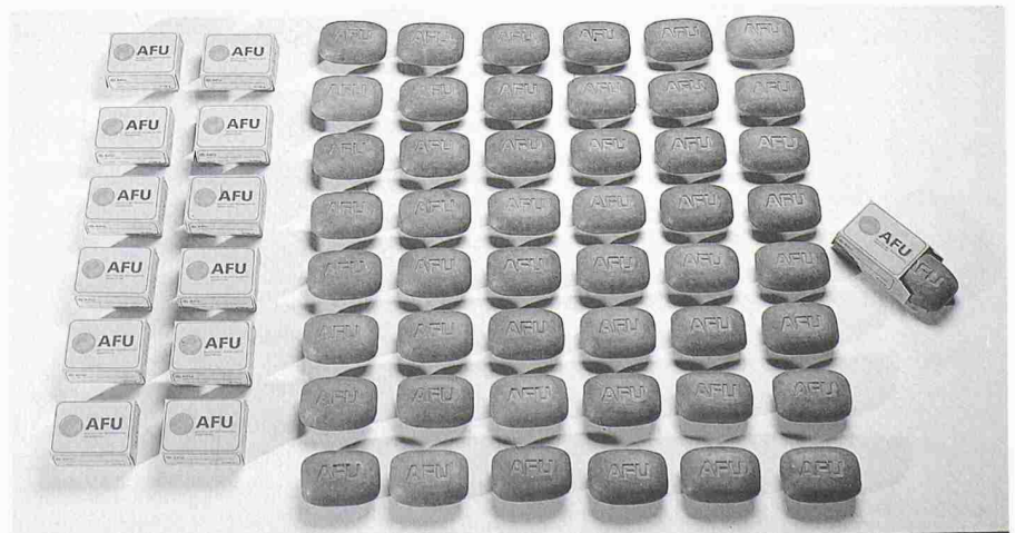
1 «Prix AFU», 1. Preis

Zu diesem Zweck wurde eine ganze Palette gemeinsamer Massnahmen entworfen. Zentral ist dabei die verbindliche Einführung der Empfehlung SIA 430 für alle Aufträge der öffentlichen Hand (Entsorgungsnachweis verbindlich vorgeschrieben). Um sowohl Auftraggebern wie auch Unternehmern die Arbeit zu erleichtern und die korrekten Entsorgungsmöglichkeiten aufzuzeigen, wurde das Zentralschweizer Bauabfall-Handbuch herausgegeben, in dem alle bewilligten Entsorgungsbetriebe aufgelistet sind. Einige Anlagen aus dieser Liste sind auch im Internet ( http://www.abfall.ch/ ) publiziert. In diesem Zusammenhang wurden für die Bewilligung von Aufbereitungs- und Zwischenlagern von Bauabfällen für die Zentralschweiz gemeinsame Richtlinien geschaffen und nun vollzogen.