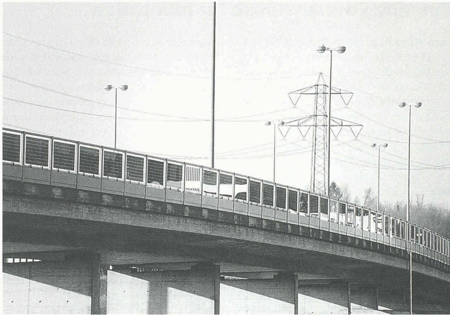
An der A1 in Wallisellen wurde eine Photovoltaikanlage in eine Lärmschutzwand integriert