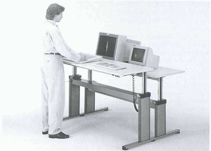
Pro Büro AG: CAD 2002

Die Firma Peterer Informatik vertreibt unter anderem das Bauadministrationsprogramm Bau für Windows. Damit lässt es sich sehr einfach, schnell und komfortabel devisieren, einen Kostenvoranschlag erstellen oder mit der Baubuchhaltung arbeiten. Neben dem Architekten werden vor allem jene Baufachleute und Systemanbieter angesprochen, die zur Hauptsache devisieren oder eine Baubuchhaltung führen müssen. Das Programm Bau ist das erste, welches