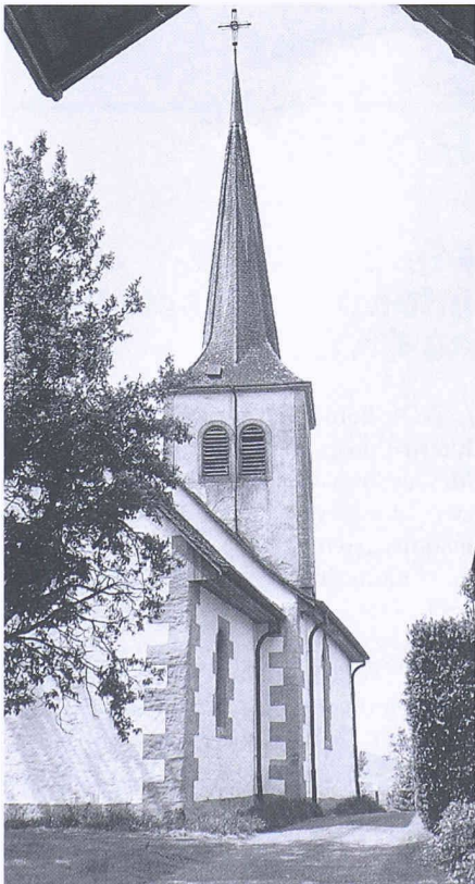
Die leerstehende Dorfkirche von Montbrelloz FR konnte restauriert und für die Bevölkerung erhalten werden

1980 publizierte die Gemeinde Montbrelloz das Abbruchgesuch für die alte, leerstehende Kirche, nachdem ihre Funktion 1964 von einem Neubau übernommen worden war. Dieser erhielt aus finanziellen Gründen jedoch keinen Turm, so dass man das Geläut der alten Kirche weiterbenützte. Gegen den Abbruch regte sich unter den Einheimischen Widerstand, woraus sich die «Association des amis de la vieille Eglise» bildete, die eine Erhaltung durchsetzte. Bei Restaurierungsarbeiten kamen im Innern der Kirche wertvolle Fresken zum Vorschein, die jetzt freigelegt werden. Nach der Wiederherstellung soll das Kirchenschiff der Bevölkerung als Veranstaltungsraum dienen.