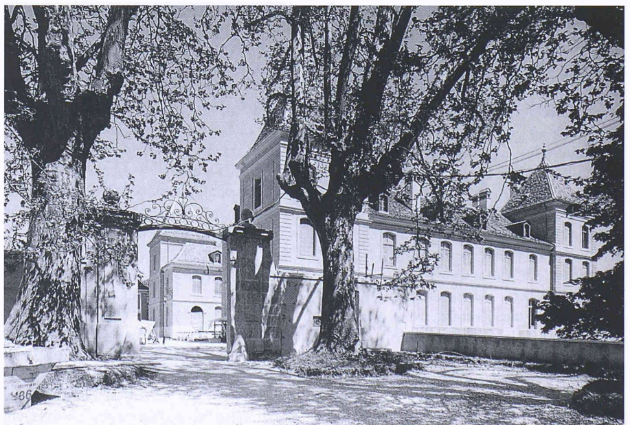
Ein Blick von NO auf Schloss Prangins, aus dem englischen Garten in Richtung des Schlossinnenhofs

(pd/Ho) Schloss Prangins bei Nyon VD wurde 1975 der Eidgenossenschaft von den Kantonen Waadt und Genf geschenkt. Das Gebäude mit einer wechsellvollen, 250jährigen Geschichte soll in eine Zweigstelle des Schweizerischen Landesmuseums umge-