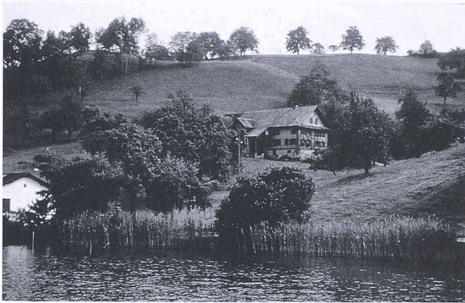
Vierwaldstättersee – Landschafts- und Naturraum von nationaler Bedeutung. Im Bild: Horw, Niederrüti