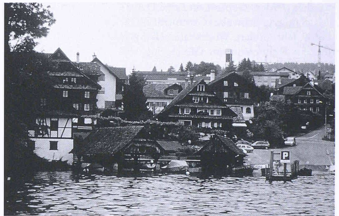
Schützenswerte Ortsbilder und Gebäudegruppen sind auszuweisen und zu sichern, wie etwa das Fischerdörfli in Meggen