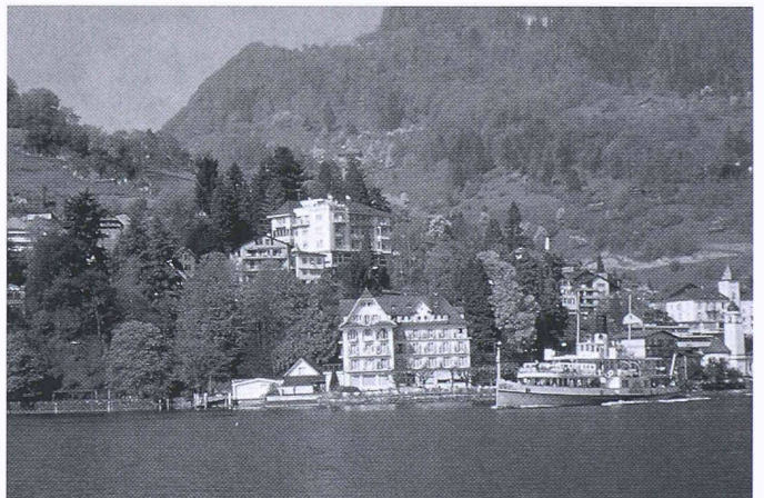
Der Wirtschaftsraum rund um den See ist geprägt vom Fremdenverkehr als bedeutendem Erwerbszweig. Es gilt unter anderem, die traditionsreiche Hotellerie zu sichern

Es ist nicht vorgesehen, über den ganzen Luzerner Teil des Vierwaldstättersees eine grundeigentümerverbindliche Verordnung oder einen separaten Teilrichtplan zu erlassen. Hingegen hat der Regierungsrat beschlossen, die wesentlichen Anliegen von kantonalem Interesse unter Berücksichtigung des durchgeführten Mitwirkungsverfahrens in die laufende Überprüfung und Anpassung des kantonalen Richtplans aus dem Jahre 1986 einzubeziehen.