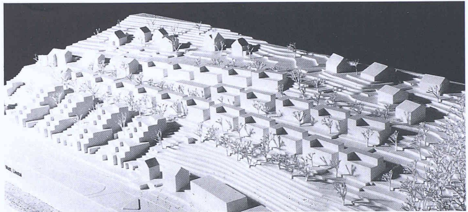
Liestal. 1. Preis: Regula Lüscher Gmür, Patrick Gmür, Zürich

Die Stadt Liestal veranstaltete einen öffentlichen Projektwettbewerb auf dem stadteigenen Areal «Untere Grosse Matt». Hier soll eine beispielhafte und zukunftsweisende Wohnüberbauung mit hoher Architektur- und Wohnqualität