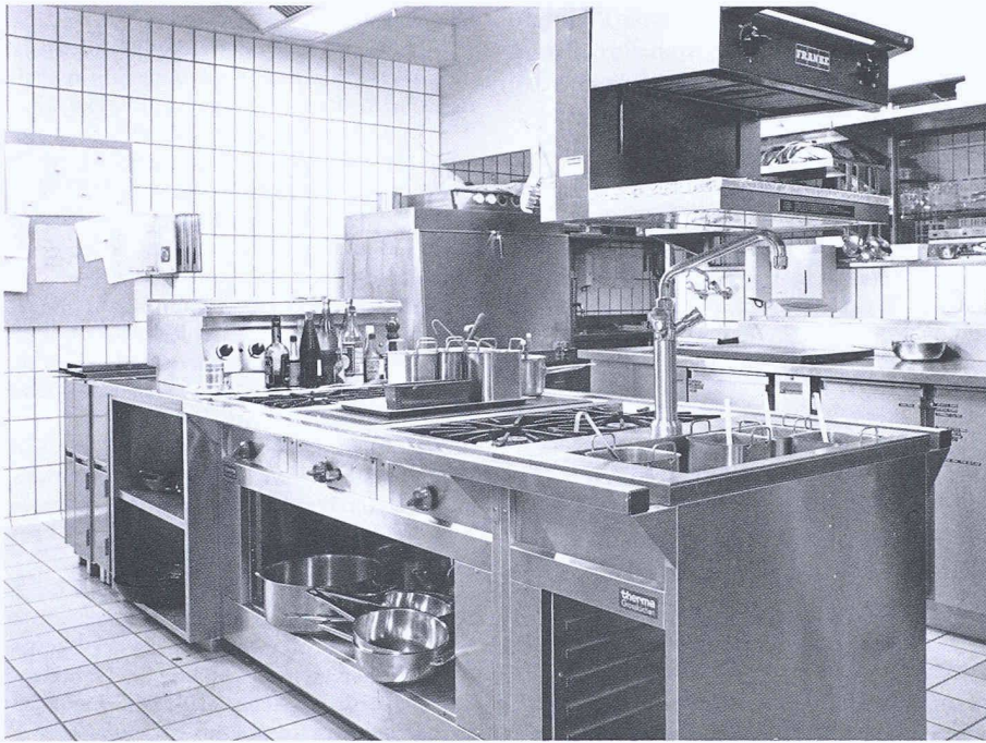
Einsatz von Gas in einer gewerblichen Küche

Ein Verbrauch in der Grössenordnung von 600 kWh/a mag für den einzelnen Haushalt als unbedeutend erscheinen, ist aber gesamthaft betrachtet trotzdem relevant, weil in der Schweiz in 87% der Haushalte total rund 2,5 Millionen Elektroherde installiert sind (VSE 1993).