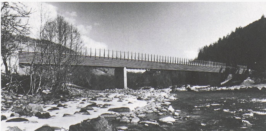
Holzbrücken und Stege überqueren heute auch ohne Dach Flüsse und Bäche. Bei der Langlaufbrücke Pradella/Scuol im Engadin schützt die Gehplatte aus Schichtholz die untenliegende Holzkonstruktion vor der Witterung (Holzingenieur: W. Bieler, Bonaduz; Architekt: R. Zindel, Chur)

Für den Brückenbau insgesamt sind die Anforderungen heute ganz anders und anspruchsvoller als noch vor hundert Jahren. Gleichzeitig hat die Forschung auf dem Gebiet der Holztechnologie heute bedeutende und praxiswirksame Resultate vorzuweisen. Während der letzten Jahre und Jahrzehnte wurden Techniken zur Verleimung hochfester Hölzer (beispielsweise Brettschichtholz aus Buche) und zur Herstellung homogenerer und zuverlässigerer Holzquerschnitte (Furnier- oder Streifenholz) vorangebracht. Es konnte mit quer vorgespannten Holzplatten erfolgreich konstruiert werden, und es wurden Furnierschicht-verleimtes Nadel- oder Laubholz und Sperrholz konstruktiv