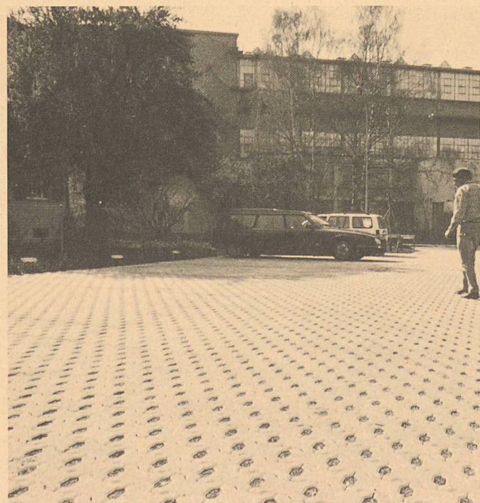
Der versickerungsaktive Ilatan-Öko-Pflasterstein

A. Tschümperlin AG 6340 Baar Tel. 042/33 34 44