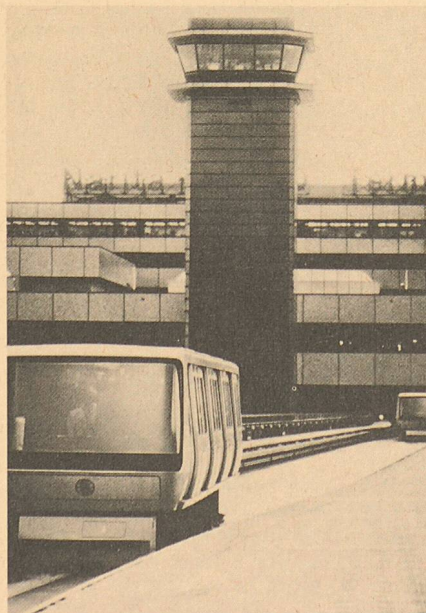
Otis-Shuttle im neuen Tokioter Flughafen