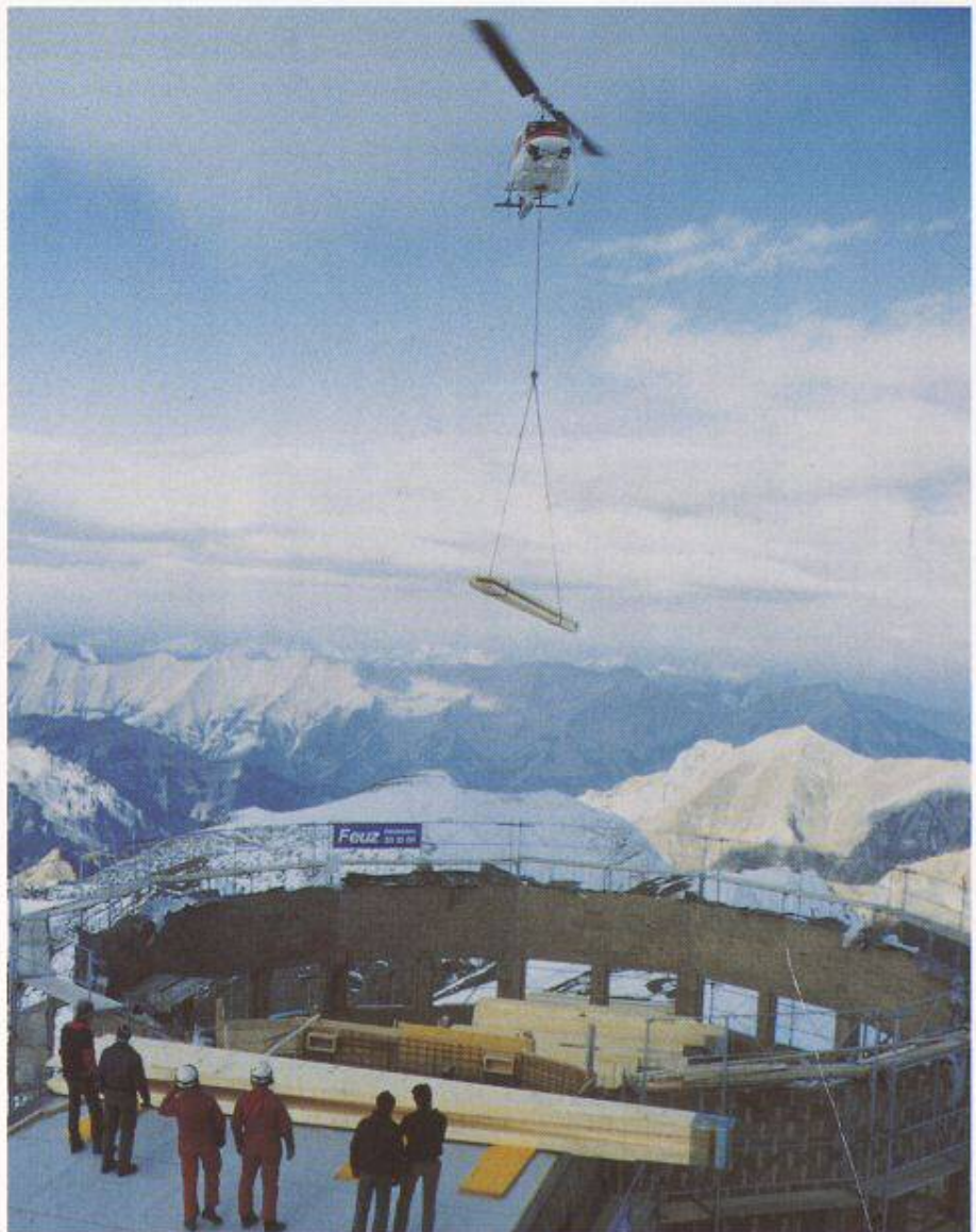
Bild 1. Deckenkonstruktion Touristorama Schilthorn, unsere höchste Baustelle mit entsprechenden Transportmitteln