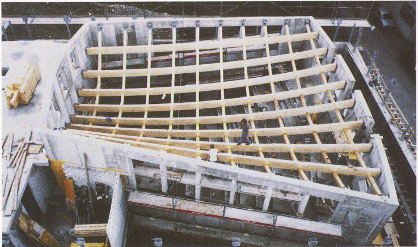
Bild 2. (rechts) Hörsaal med vet Fakultät der Universität Bern, die dreidimensionale Hängeschale verlangt grösste Präzision