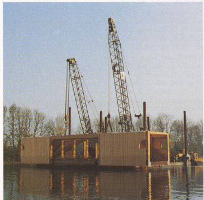
Bild 4. Aarebrücke bei Büren a.A., knappe Platzverhältnisse zwingen zur Entwicklung neuer Verbindungsmittel und zu einer unkonventionellen Montageweise.

rüstungen sinnvollerweise Rücksicht genommen werden sollte.