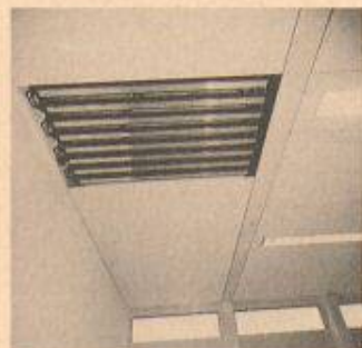
Die Flexi-Cool-Kühldeckensysteme von ABB Fläkt AG erbringen hohe Kühlleistungen bei niedrigen Investitions- und Betriebskosten.

Der Stand soll dem Besucher den Einfluss des richtigen Raumklimas auf den Menschen wirkungsvoll demonstrieren. Dass dabei die heutigen Anforderungen im Umgang mit Energie und Umwelt nicht vergessen werden, ist ein weiteres zentrales Thema des ABB-Standes. Energiesparende Anlage und die Verwendung von umweltfreundlichen Materialien ist für ABB eine Selbstverständlichkeit. An der Hilsa werden Produkte und Lösungen für die wirtschaftliche Lüftung und Klimatisierung bei vertretbarem Investitionsaufwand und minimalen Betriebs- und Wartungskosten angeboten.