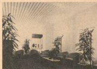
Hesco zeigt Lüftungs- und Klimatechniksysteme

Hesco Pilgersteg AG 8630 Rütli Halle 5, Stand 226