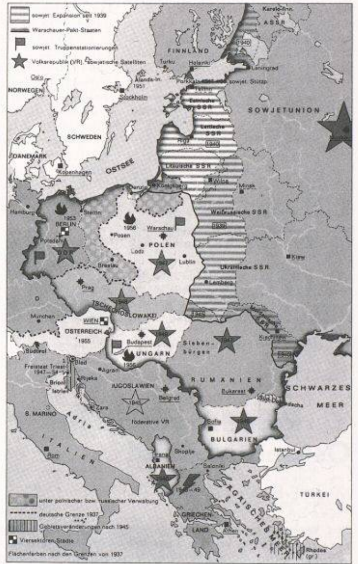
Bild 3. Das sowjetische Satellitensystem in Europa nach 1945