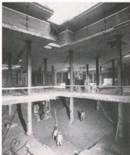
Bild 4. Die Untergeschosse werden in Deckelbauweise erstellt

Betonkonsolen mit der Schlitzwand verbunden ist, auf Stahlstützen liegt und grosse Öffnungen zum Abtransport des Aushubmaterials ausweist (Bild 4).