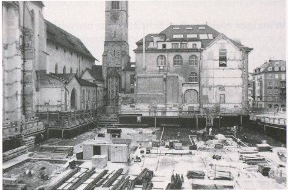
Bild 1. Die Baustelle Zentralbibliothek Zürich nahe der Limmat (rechts der Seilergraben)

Hohe Sicherheit bieten Abdichtungssysteme, bei denen eine innere Gebäuhülle durch einen Kontrollgang bzw. einen belüfteten Hohlraum von der äusseren, wasserdichten Hülle entkoppelt ist. Neben den hohen Baukosten geht