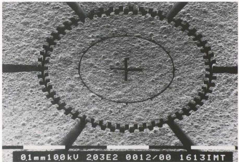
Rasterelektronenmikroskopische Aufnahme des Schrittmotors. Der Läufer des Schrittmotors ist von 6 Statorelementen umgeben, wobei die Rotation des Läufers durch das elektrische Wechselfeld zwischen den Zahnkränzen von Läufer und Statorelementen erzeugt wird. Die Drehfrequenz des Läufers ist variierbar vom Einzelschrittbetrieb bis 3400 Umdrehungen pro Minute

Durch geschickte Kombination der LIGA-Prozessschritte mit lichtoptischen Strukturierungsmethoden können mit diesem Verfahren auch bewegliche Strukturen hergestellt werden. Die beweglichen Teile werden dabei auf