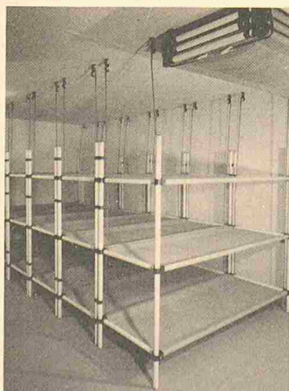
Ubag-Schutzraumliege: hängende Deckenkonstruktion

Die Ubag-Schutzraumliege kann in Friedenszeiten oder tagsüber bei Alarmzustand auf einfachste Weise hochgezogen und an der Decke befestigt werden. Dadurch wird zusätzlich