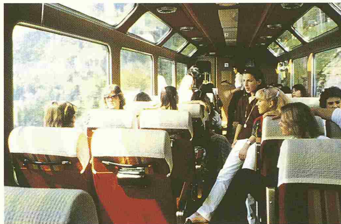
Bild 2. Innenansicht eines zehnjährigen Panoramawagens der MOB (Montreux-Oberland Bernois) (Ramseier + Jenzer Bus + Bahn)

Gewichtsanteil der Drehgestelle zu rechnen.