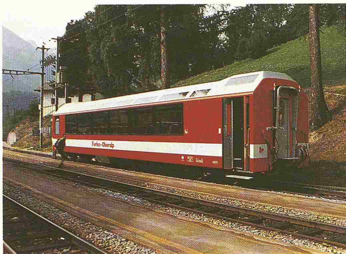
Bild 1. Panoramawagen der Furka-Oberalp-Bahn (Ramseier + Jenzer Bus + Bahn)