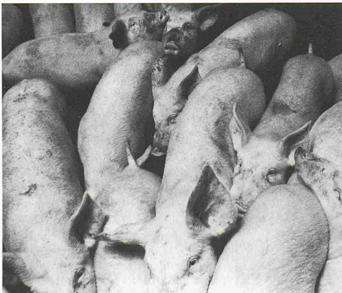
Zuviel Vieh, insbesondere der sehr hohe Schweinebestand, produziert rund um den Sempachersee zuviel Hofdünger. Durch Überdüngung gelangt laufend viel zu viel Phosphor in den See

Wie alle Grünpflanzen geben die Algen beim Aufbau des Pflanzenmaterials unter Einwirkung von Licht Sauerstoff ab (sog. Photosynthese). Bei zu vielen Algen kommt es in den oberflächennahen Seeschichten - im Gegensatz zu den Zonen über dem Grund - zu einer Sauerstoffübersättigung, die insbesondere bei Jungfischen zur sog. Gasblasenkrankheit und damit zu einem massenhaften Sterben von Brütlingen führen kann, wie es auch schon in anderen überdüngten Seen (Baldegger- und Greifensee) beobachtet wurde. Um dies zu verhindern, werden die Jungfelchen im Sempachersee seit dem vergangenen Jahr in Netzkäfigen aufgezogen, die tiefer als drei Meter unter der Wasseroberfläche hängen.