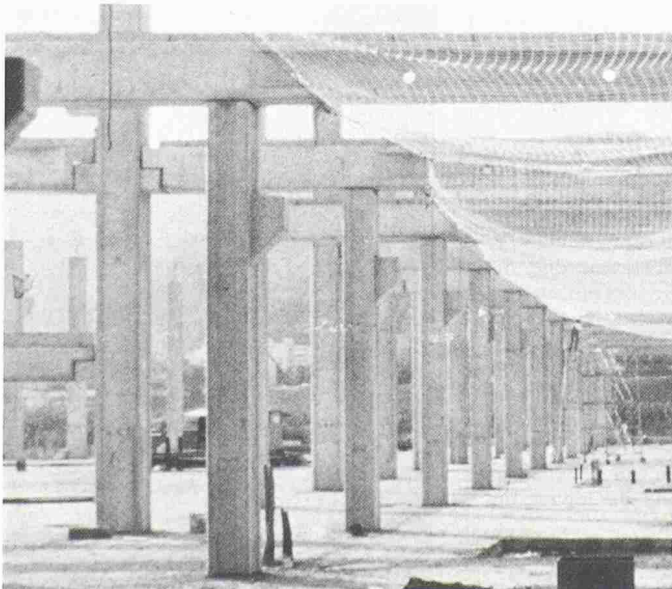
Auf einer Grossbaustelle werden Auffangnetze montiert