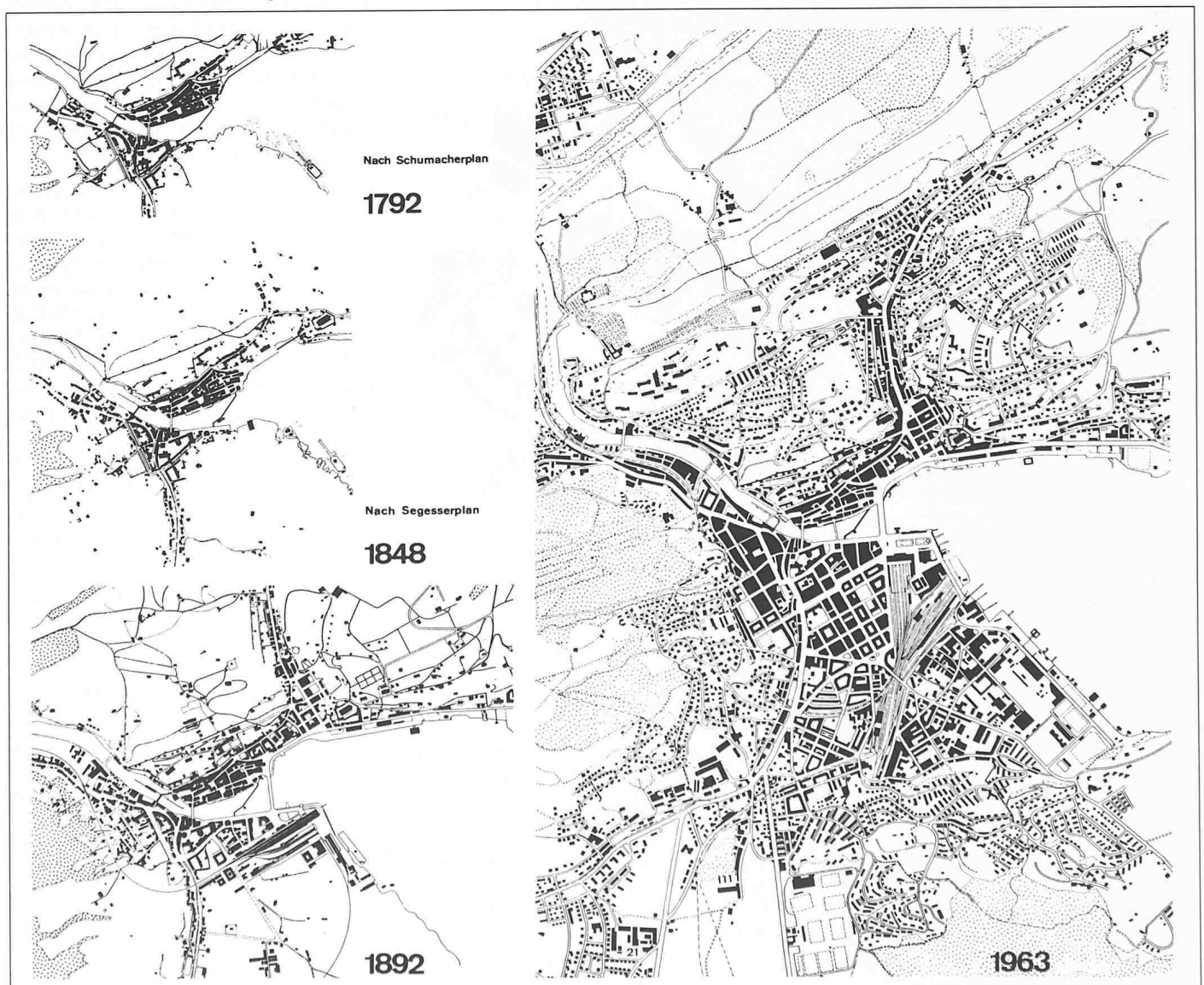
Bild 1. Städtebauliche Entwicklung der Stadt Luzern

Ein mehrjähriger, allseitig konstruktiver Lern- und Reifeprozess beeinflusste in der Folge Programmgestaltung und Randbedingungen, so dass über die Etappen eines städtebaulichen Ideenwettbewerbes (1975) und eines zweistu-