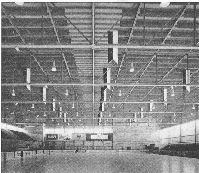
Sportzentrum Herisau. Innenansicht der Eishalle. Die Schallschutzschikanen an der Decke sind sichtbar

mittels Holzpfetten verstärkten Novopanplatten. Die Dachhaut besteht aus einer Hescoplan-Folie. Die Windkräfte werden durch die Betonstützen aufgenommen. Das feste Auflager der Fachwerke befindet sich auf den durch die Tribüne aus-