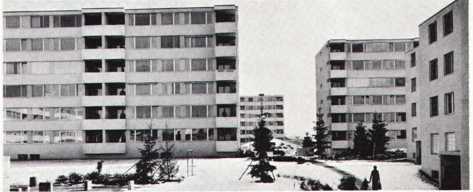
Überbauung Rain, Jona SG