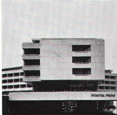
Hotel Atlantis, Zürich