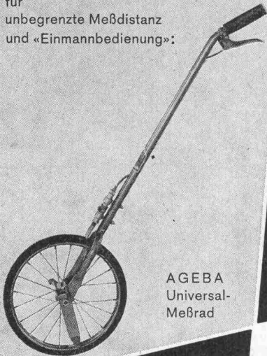
AGEBA Universal- Meßrad

für unbegrenzte Meßdistanz und «Einmannbedienung»: