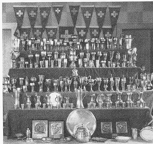
Nordiska-Trophäen: hinten die Meisterschaftsfähnchen im Rudern und vorn Preise von den Schweizer Ski-meisterschaften

Leben geschlossen, und aus dem Gästebuch im Nordiska Clubhouse kann man ersehen, dass viele damalige ETH-Studenten aus «Heimweh» nach der Schweiz die Stadt an der Limmat wieder besuchen.