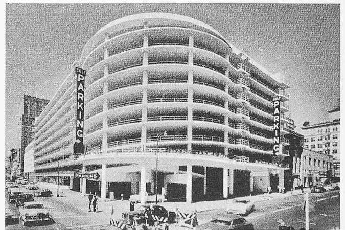
Bild 2. Ecke des Garagegebäudes mit Einfahrt und Aufstiegsrampe (unterster Teil der Abstiegsrampe im Erdgeschoss rechts der Bildmitte sichtbar).