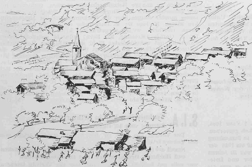
Abb. 13. St. Germain im Wallis als Beispiel eines giebelständigen Bergdorfes mit der überragenden, durch Querstellung dominierenden Kirche. Trotz Standardisierung und Gleichrichtung besitzen Haus und Siedlung Charakter, sodass selbst der Laie ohne weiteres den zugehörigen Landesteil angeben kann.

Mit der gleichen Betonung der Traufseite vereinigt das Dreisässenhaus des Mittellandes (Abb. 9) unter einem Dache den Wohn- und Oekonomie teil. Auf grossen Heimwiesen werden wie beim Landenhaus der Alpen die Stuben, Ställe und Tennen verdoppelt, was zu langen Trauffronten führt. In den Dörfern bilden die Zeilenbauten und Reihenhäuser Trauffronten von Strassenlänge im Gegensatz zu den Dörfern der Alpen und Voralpen, wo sich die Einzelhäuser mit ihren Giebeln quer zu den Plätzen und Strassen aufreihen.