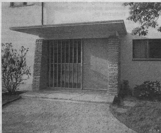
Abb. 11. Entrée mit Haustüre und Glaswand

Die Generalversammlung des S. I. A. in Zürich (vgl. S. 104 lfd. Bds.) hat sich programmgemäss abgewickelt; Protokoll, Tätigkeitsbericht und Antrag der Delegiertenversammlung wurden diskussionslos genehmigt, sodass die nächste Generalversammlung 1947 in Graubünden zur Durchführung gelangt. Prof. E. Brunners Vortrag über «Technik und Religion in der Gegen-