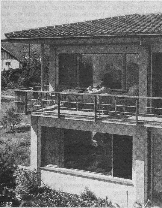
Abb. 8. Südfassade, Ausschnitt