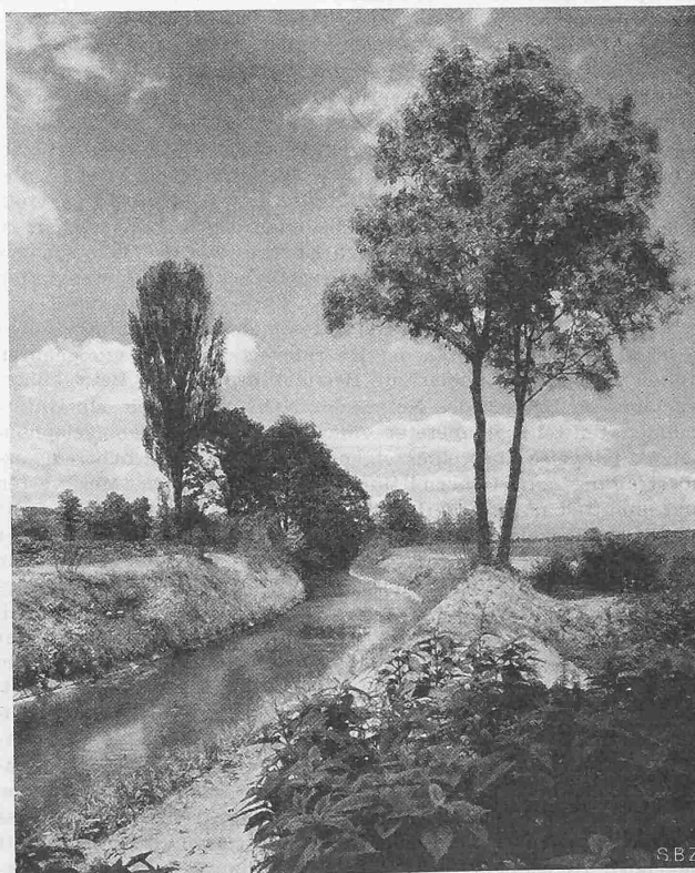
Abb. 4. Durch leichte Schmiegun g des Laufes und Schonung der Vegetation fügt sich auch ein korrigierter Bachlauf ins Landschaftsbild