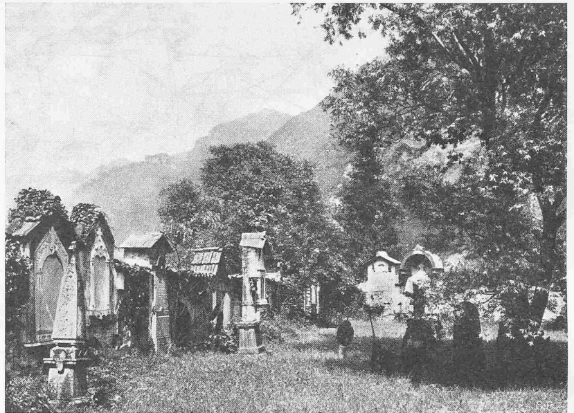
Abb. 1. Charakteristischer alter Friedhof im Mendrisiotto (Tessin)

solchen stellen sich jedoch nicht unerhebliche Schwierigkeiten entgegen. Einmal sind die natürlichen Wasserkräfte sehr ungleich über das Land verteilt und teilweise verhältnismässig weit von den grossen Konsumgebieten abgelegen. Sodann liegt die schweizerische Energieversorgung in der Hand einer grösseren Zahl voneinander unabhängiger Unternehmungen, weshalb eine gemeinsame Bewirtschaftung der Wasserkräfte nur durch eine gegenseitige Verständigung der verschiedenen Werke gewährleistet werden kann. Endlich aber weisen die einzelnen Zentralen, je nachdem es sich um Laufwerke an den Flachlandflüssen oder Hochdruck-Speicherwerke handelt, eine sehr verschiedene jahreszeitliche Produktionskurve auf, und eine mehr oder weniger gleichmässige Belieferung der Energiekonsumenten während des ganzen Jahres ist daher nur vermittels einer Verbundwirtschaft möglich, die Werke von entgegengesetzter Charakteristik in den Dienst eines und des selben Versorgungsgebietes stellt.