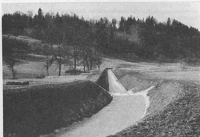
Abb. 3. Alte Schule, Gegenbeispiel: in Grundriss und Längenprofil schematische, rücksichtslose Trassierung einer Bachkorrektur

Mit Nachdruck betonte auch Dir. Keller, dass es die notwendigerweise immer begrenzte Leistungsfähigkeit der Uebertragungs- und Verteilnetze verhindere, auch aussergewöhnlichen