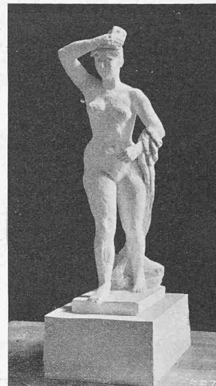
Standort 1, 1. Preis: EMILIO STANZANI