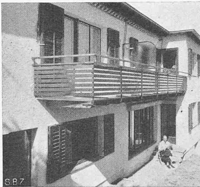
Abb. 4. Detail der Südfront