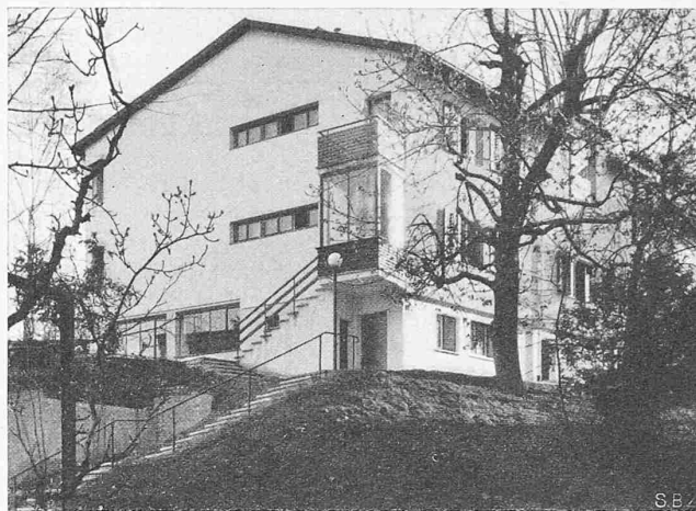
Abb. 5. Ostgiebel mit Eingängen 1 und 2 (vgl. Abb. 1)

verlegen seinen Anfang an das unterhalb Genf liegende Kraftwerk Chancy-Pougny. Die Staustufe von Verbois muss mit zwei Schleusen von 17 bis 20 m Hubhöhe überwunden werden. Das Genfer Kraftwerk in Chévres ist zu beseitigen, um in das Gebiet des zukünftigen Hafens der Stadt Genf zu gelangen. Es folgt das grösste Hindernis für den Bau des transhelvetischen Kanals, der Durchgang durch die Stadt Genf. Hier ist auf Grund zahlreicher Studien ein 2,3 km langer Tunnel unter der Stadt hindurch in Aussicht genommen, an den beidseits je ein Vorhafen mit Schleuse sich anschliessen.