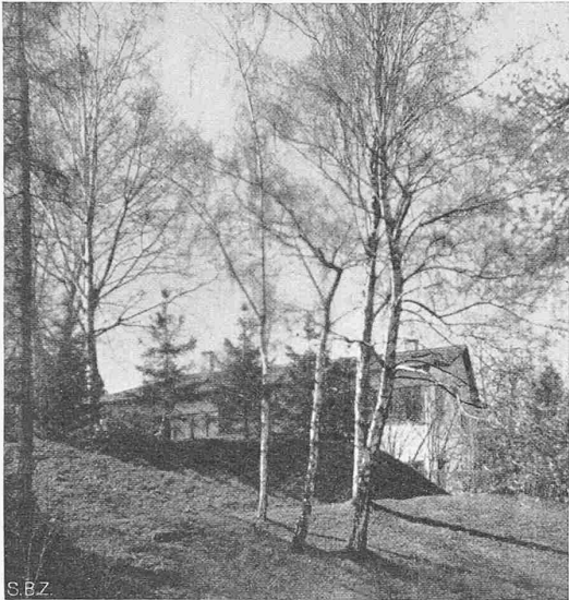
Abb. 2. Ansicht von Südost (vgl. Lageplan)

Wohnhaus zum Geissberg in Zürich. Architekt MORITZ HAUSER, Zürich (Text siehe Seite 308)