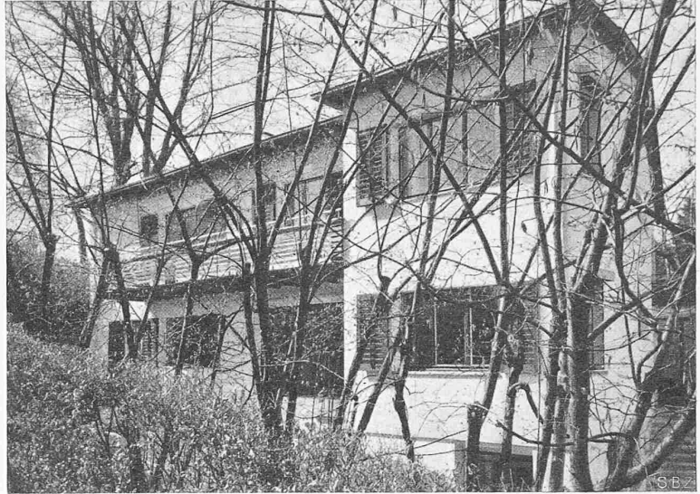
Abb. 3. Ansicht von Südost, rechts das Haus Schlatter