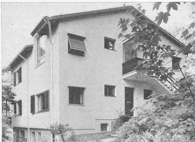
Abb. 6. Westgiebel mit Eingängen 3 und 4 (vgl. Abb. 1)