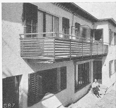
Abb. 4. Detail der Südfront