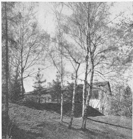
Abb. 2. Ansicht von Südost (vgl. Lageplan)

Wohnhaus zum Geissberg in Zürich. Architekt MORITZ HAUSER, Zürich (Text siehe Seite 308)