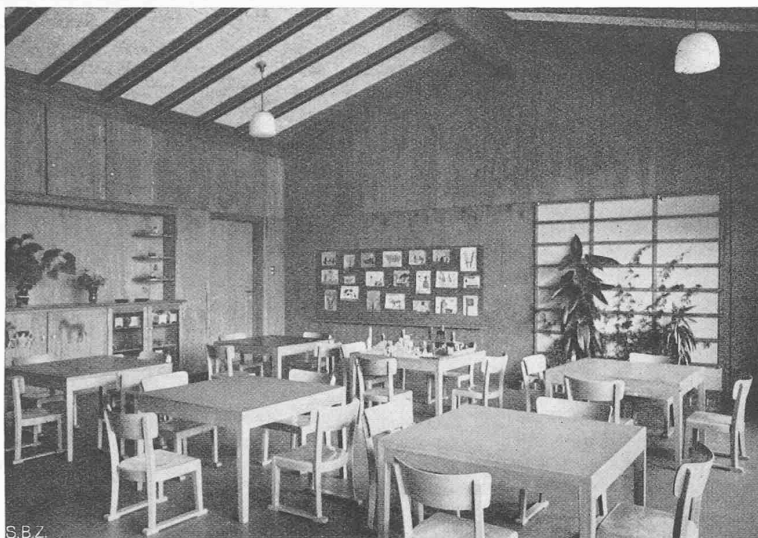
Abb. 11. Arbeitsraum im Kindergarten Spitalacker, Bern

Sollte es indessen an dem nötigen Vertrauen in die anderen Kollegen, insbesondere die Nichtmitglieder, oder in den Bauherrn fehlen, dann könnte etwa folgende Lösung in Betracht kommen: