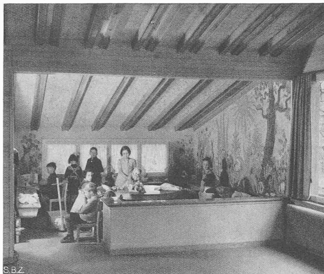
Abb. 9. Puppenstube

Kindergarten Spitalacker Bern, städt. Hochbauamt