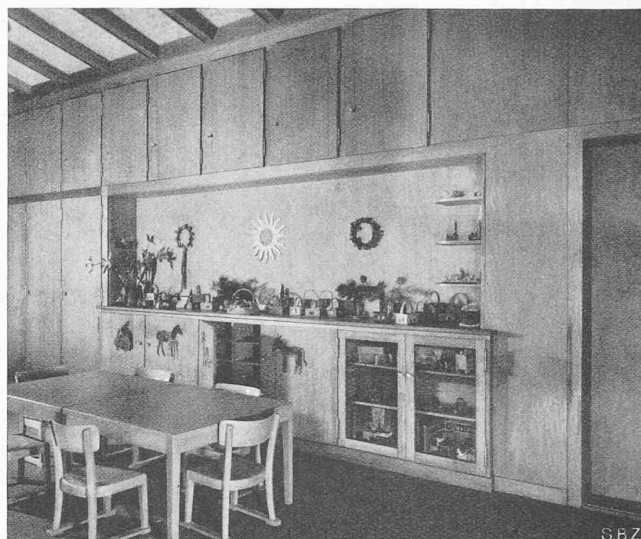
Abb. 10. Rückwand im Arbeitsraum

Kindergarten Spitalacker Bern, städt. Hochbauamt