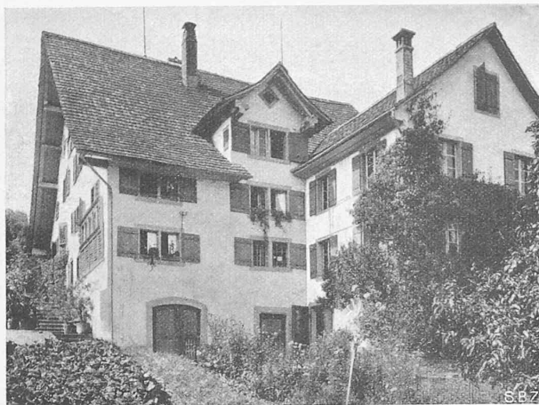
Lehmhof in Wädenswil (Bez. Horgen).