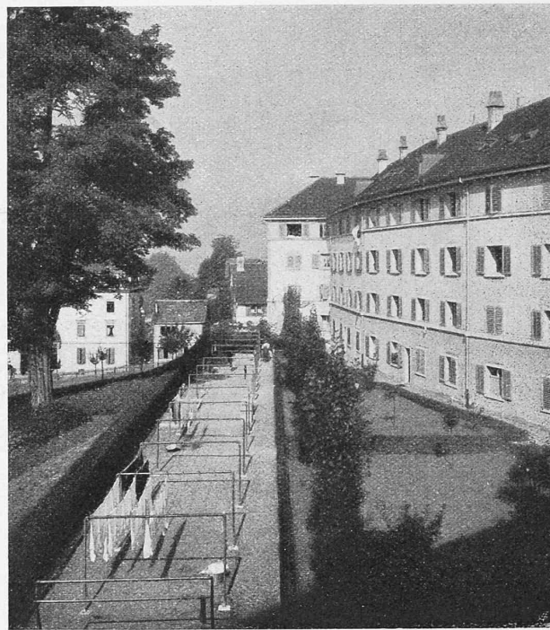
Abb. 14. Rückseite der Häuser I bis VI an der Imfeldstrasse, aus Südost.