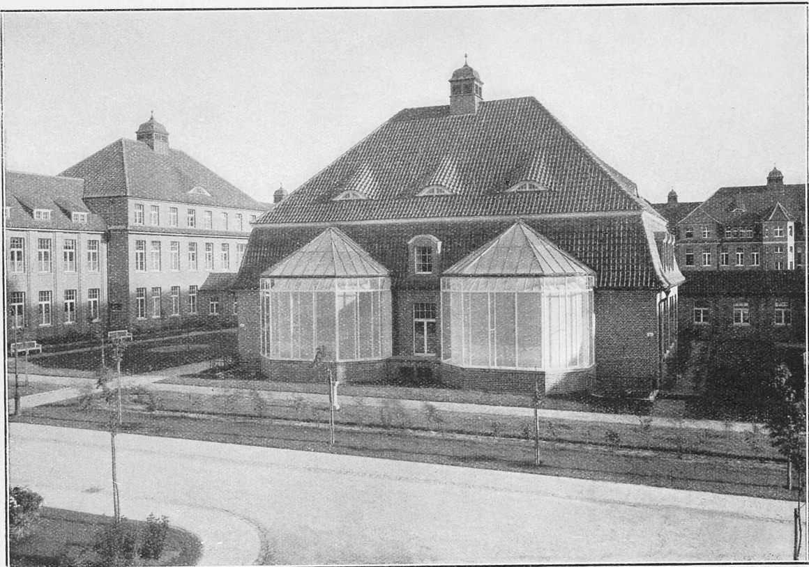
Abb. 2. Operationshaus des Allgemeinen Krankenhauses Hamburg-Barmbeck.

Zu diesen Hauptforderungen tritt eine Reihe anderer Einzelforderungen, die sich auf Heizung, Ventilation, zweckentsprechende Installation aller mechanischen, elektrischen und sonstigen Anlagen und Ausstattungen beziehen, deren einwandfreie technische Durchführung ebenfalls für eine vollkommene bauliche Ausgestaltung des Operationsssaales sehr ins Gewicht fällt.