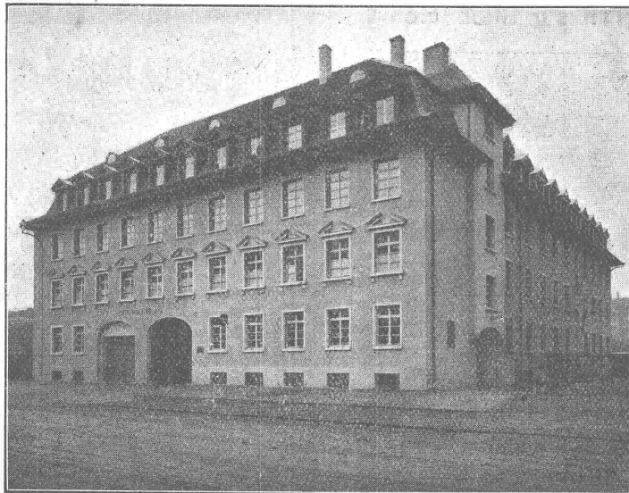
Neubau der Otto Fischer A.-G., Sihlquai 125, Zürich 5 Engrosvertrieb und Fabrikation elektrotechnischer Bedarfsartikel

HEINRICH HATT-HALLER, ZÜRICH HOCH- UND TIEFBAU-UNTERNEHMUNG