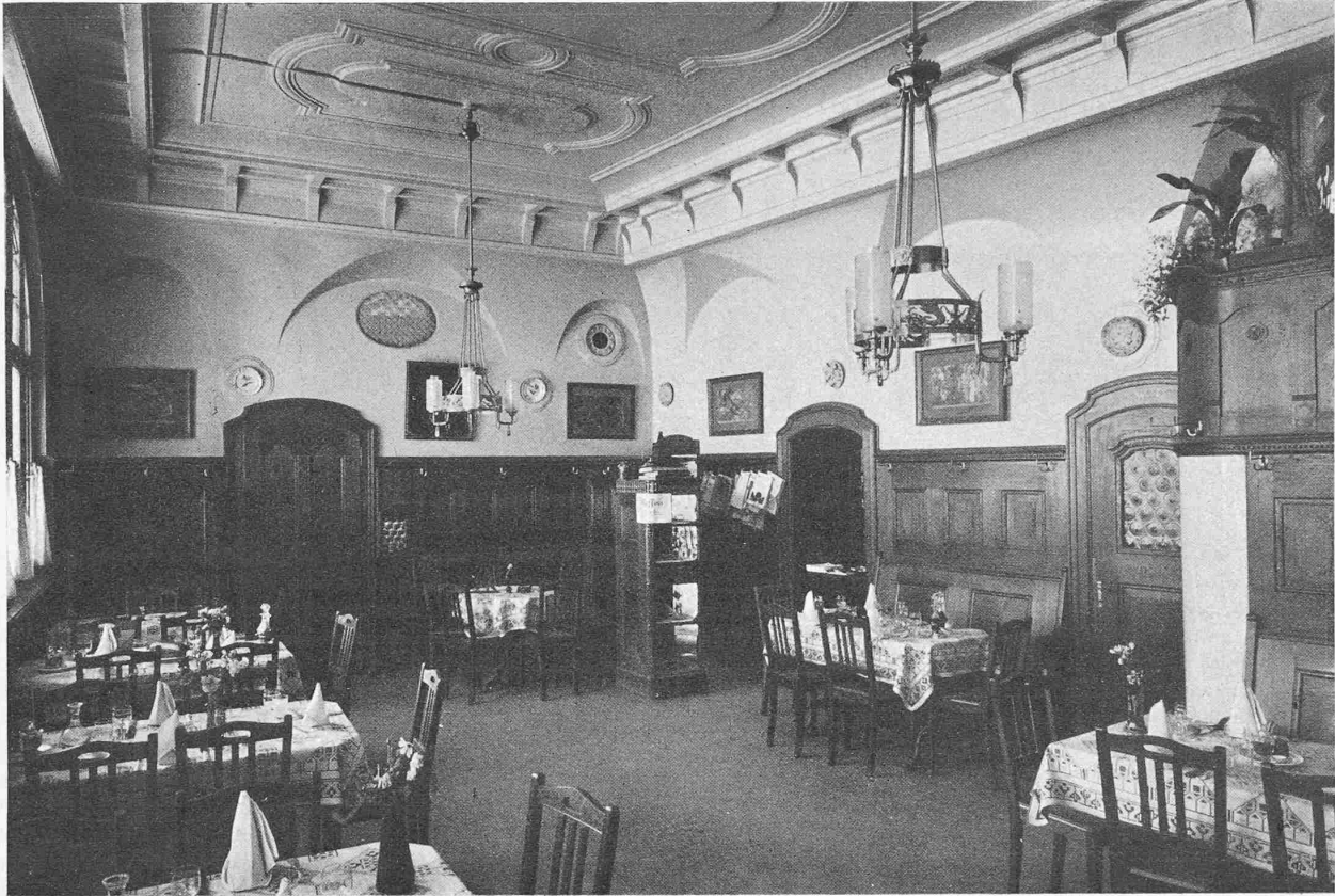
Abb. 11. Der Restaurationssaal im Erdgeschoss.

fertig erstellt. Die Montierung der Maschinen, Krane, Kessel usw. ist in Ausführung begriffen.