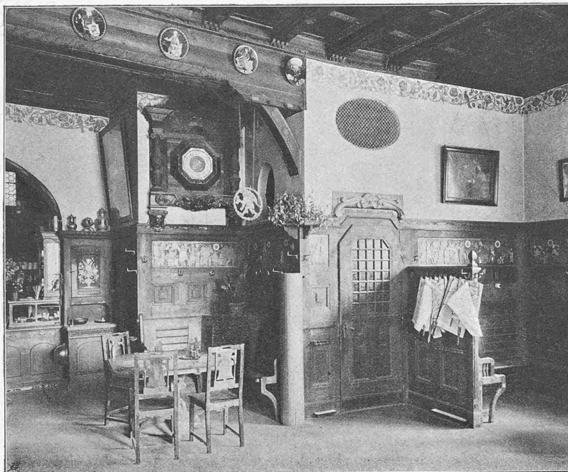
Abb. 13. Eingangstüre und Uhr in der Nordostecke des «Café».