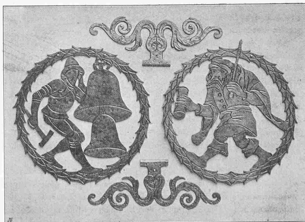
Abb. 12. Kunstschlosserarbeiten von Probst & Bergner in Bern.

speziell einzuladen, die Bauarbeiten künftighin auf intensive und tunlichst wirksame Weise, durch ihre Organe kontrollieren zu lassen und dabei namentlich auf die rechtzeitige Ausarbeitung und Einreichung der einzelnen Bauvorlagen, auf die rechtzeitige Beschaffung und Zufuhr der Baumaterialien, sowie auf die strikte Einhaltung der Weisungen der Aufsichtsbehörde und der an die Genehmigung der einzelnen Bauprojekte geknüpften Vorbehalte Bedacht zu nehmen.