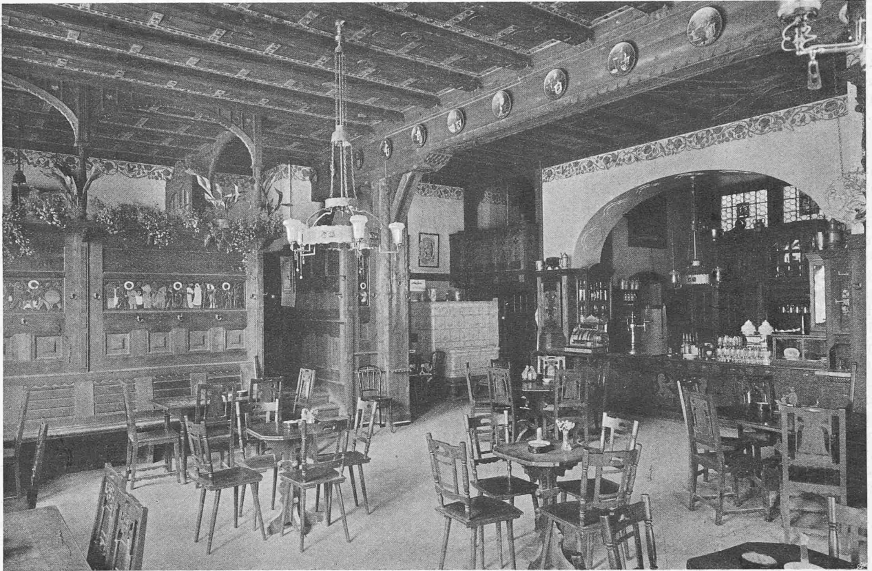
Abb. 10. Das «Café» im Erdgeschoss. — Ansicht aus der Südstecke.

Zu erwähnen ist schliesslich der bereits erfolgte Ankauf der Spiez-Frutigen-Bahn durch die Berner-Alpenbahn-Gesellschaft, welche diese Strecke sofort elektrisch auszurüsten gedenkt, um auf derselben die nötigen Studien über das zu wählende definitive System für den Betrieb der ganzen Linie vornehmen zu können.