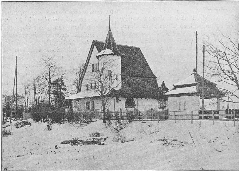
Abb. 4. Ansicht von Südwesten.