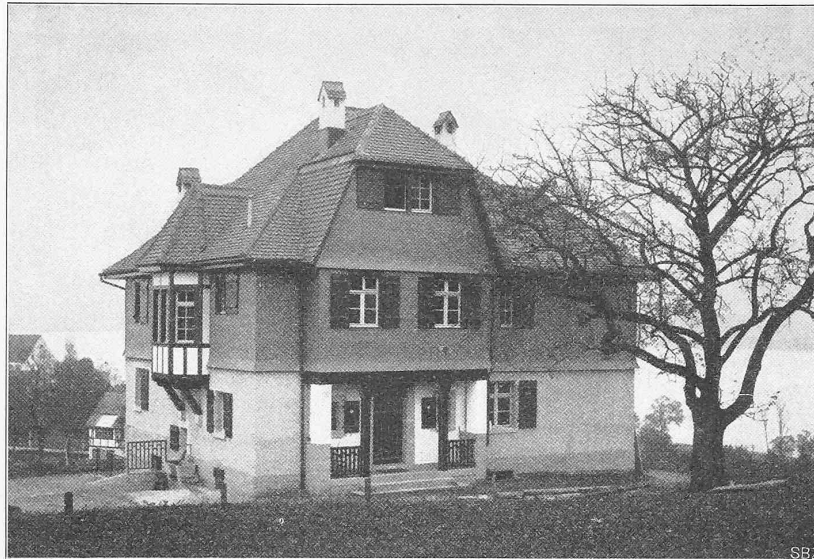
Abb. 9. Ansicht des Hauses von Hermann Hesse in Gaienhofen von Nordwesten.

Das von der Gornergratbahn vorgelegte Projekt für die Verlegung der obern Endstation in die Nähe des