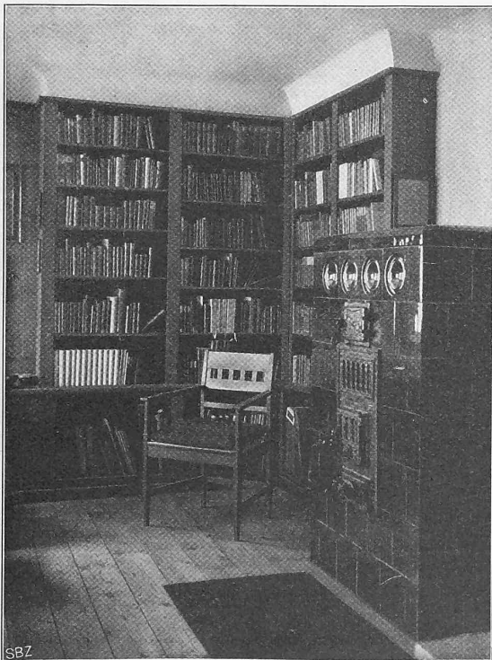
Abb. 11. Bibliothek des Hauses von Hermann Hesse in Gaienhofen.

Von der Schmalspurbahn Biasca-Acquarossa-Ollone wurde das allgemeine Bauprojekt der I. Sektion: Biasca-Acquarossa am 26. April genehmigt. Die Bauarbeiten werden jedoch erst nach Genehmigung des Finanzausweises durch die kantonalen und eidgenössischen Behörden, d. h. etwa im Frühjahr 1908, beginnen können.