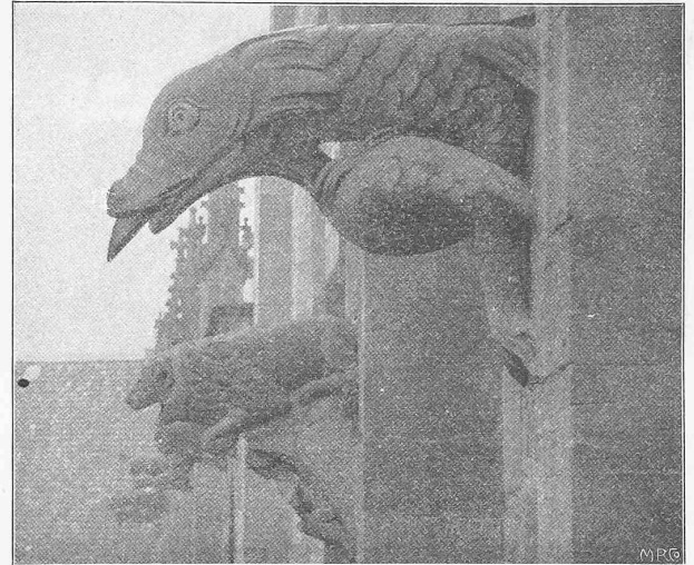
Abb. 2. Wasserspeier an der nördlichen Langhausfassade.

die Spannweiten sind so gegen einander abgestimmt, dass die Horizontalschübe für Eigengewicht gleich werden, wodurch die Pfeilerstärke am Kämpfer auf das Mindestmass von 3 m beschränkt werden konnte. Die Mittellinie der Gewölbe fällt mit der Drucklinie für Eigengewicht zusammen. Ausserdem sind zwei weitere Entwürfe in Massivbau (ähnliche Abmessungen in Eisenbetonkonstruktion) angekauft worden. Erfreulicherweise haben die Mülheimer Stadtverordneten dem Vorschlage des Preisgerichts zugestimmt, wodurch die Ausführung des an erste Stelle gesetzten Projektes, dessen Kostenvoranschlag rund 820 000 Fr. erreicht, gesichert ist.