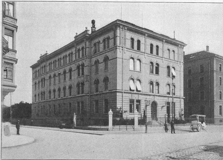
Ansicht der Polizeikaserne von Süden.

Durch die Volksabstimmung vom 3. Juli 1898 ist einem Tauschvertrag zwischen Kanton und Stadt Zürich die Genehmigung erteilt worden, gemäss welchem das Areal des ehemaligen Klosters im Oetenbach in den Besitz der Stadt