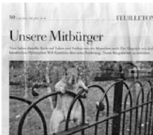
«Unsere Mitbürger», Artikel in der Wochenzeitung «Die Zeit» (2012)

Die Entdeckung von Tieren als Personen ist im populären Diskurs der westlichen Spätmoderne zumeist gleichzusetzen mit einer Anthropomorphisierung, einer Vermenschlichung, der Tiere. Diese kulturelle Praxis ist im Kontext der bürgerlichen Gesellschaften nicht neu. Neu ist allerdings die wachsende Diskussion der westlichen Gesellschaften über ihre Praktiken im Umgang mit Tieren, über ihre sozialen und rechtlichen Ordnungen sowie die Stellung der Tiere darin. Neu ist auch die derzeit geführte breite Debatte über theoretische Bestimmungen des Mensch-Tier-Verhältnisses. Radikale Theorien werden plötzlich in der gesellschaftlichen Mitte populär. Die Theorien des kanadischen Politikwissenschaftlers Will Kymlicka und der Kulturwissenschaftlerin Sue Donaldson gehören beispielsweise dazu. 11 Ausgehend vom Multikulturalismus haben sie eine politische Theorie der Tierrechte entwickelt, der zufolge Tiere Bürgerrechte erhalten sollen. Damit werden Tiere gewissermassen zu Mitbürgern. Dies hat einschneidende Folgen: Mitbürger verzehrt man nicht, man beraubt sie nicht ihrer Kinder oder ihres Eigentums, man darf sie nicht fahrlässig mit dem Auto überfahren etc. Vegetarismus und Veganismus sind nur zwei von vielen weiteren möglichen Konsequenzen, die sich aus einer derart radikalen Neubestimmung des Mensch-Tier-Verhältnisses ergeben.