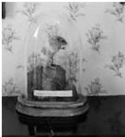
Die 1877 verstorbene Maus Minkrill