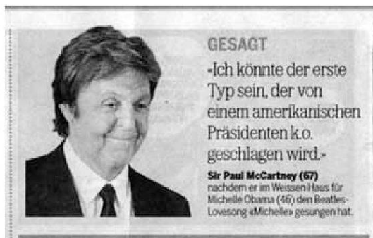
«20 Minuten», 4.6.10, S. 19