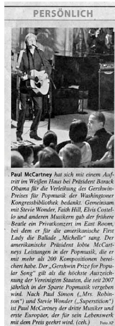
«FAZ», 4.6.10, S. 8

Wie wenig die «20 Minuten» auf einen Hau-Drauf-Stil gepolt ist, zeigt übrigens der Text über Lady Gaga. Wie die «FAZ» berichtet auch das Gratisblatt über Lady Gagas Erkrankung und zwar genauso sachlich. Der Leser wird im Boulevardblatt gefordert, verschiedene Stillagen neben- und miteinander zu realisieren. Nur das Bild und seine Unterschrift geben dem Sachtext einen zusätzlichen Kick mit der vieldeutig zu beziehenden Anspielung: «Grenzwertig positiv: Lady Gaga».