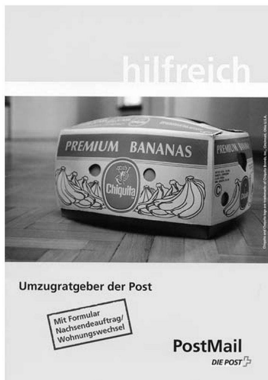
Die Schweizerische Post/Prospekt August 2004