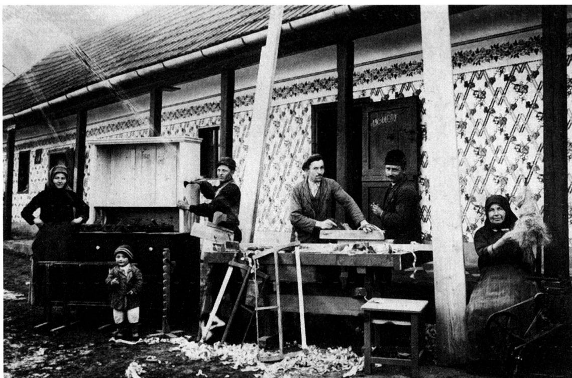
Abb. 6: Tischlerei um 1930 in Schöndorf.