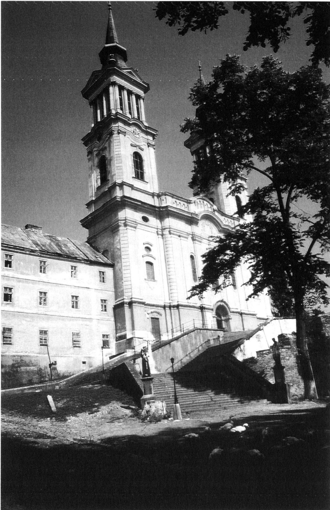
Abb. 1: Basilika des Franziskanerklosters Maria Radna.