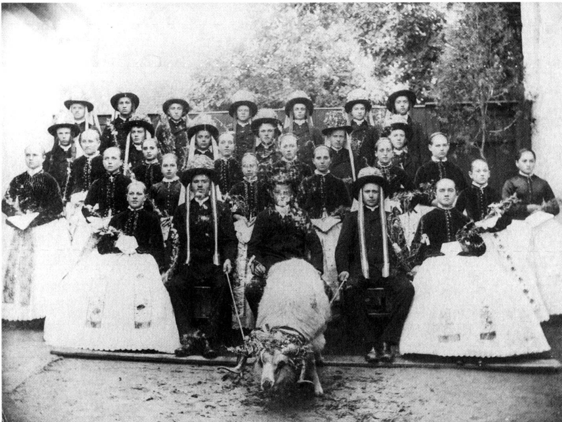
Abb. 5: Aufnahme anlässlich der Kirchweih 1890 in Lippa.