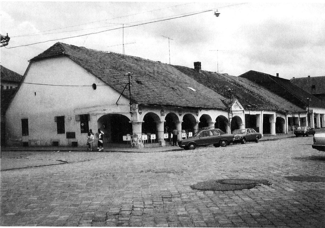
Abb. 2: Der alte Basar in Lipka.