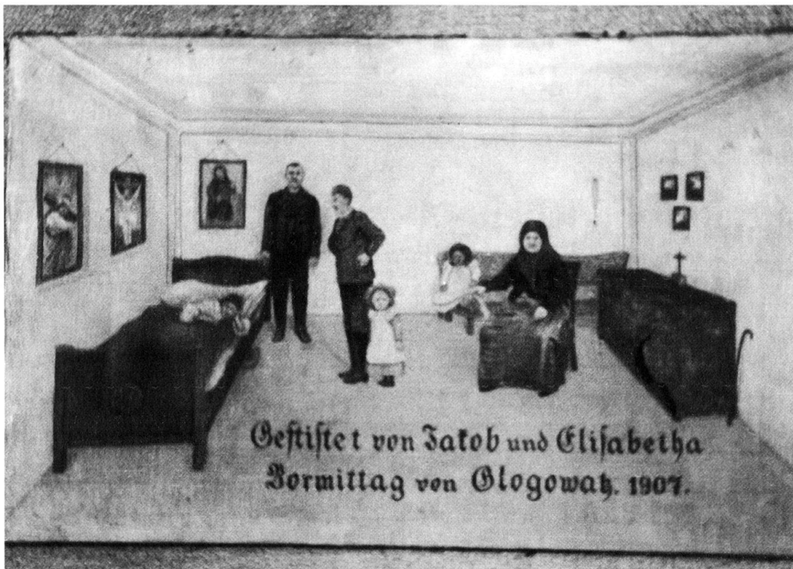
Abb. 8: Votivbild aus Glogowatz (Krankheit 1907).