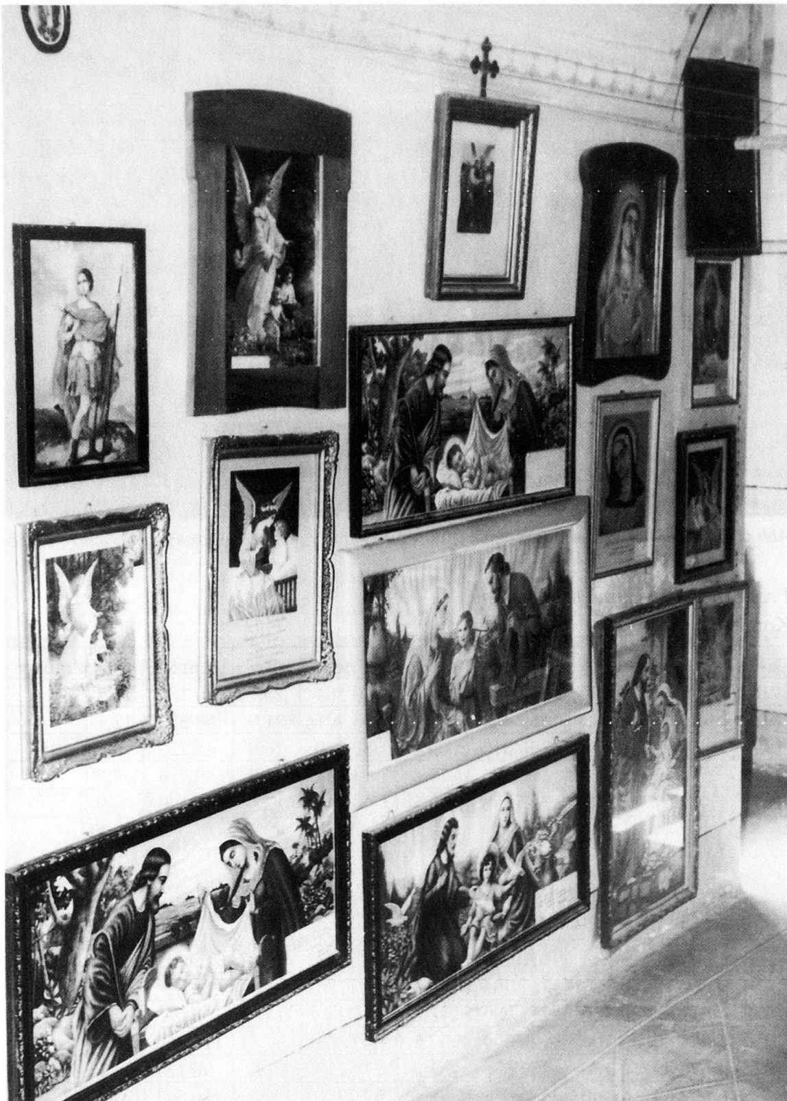
Abb. 7: Korridor im Kloster mit Votivbildern.