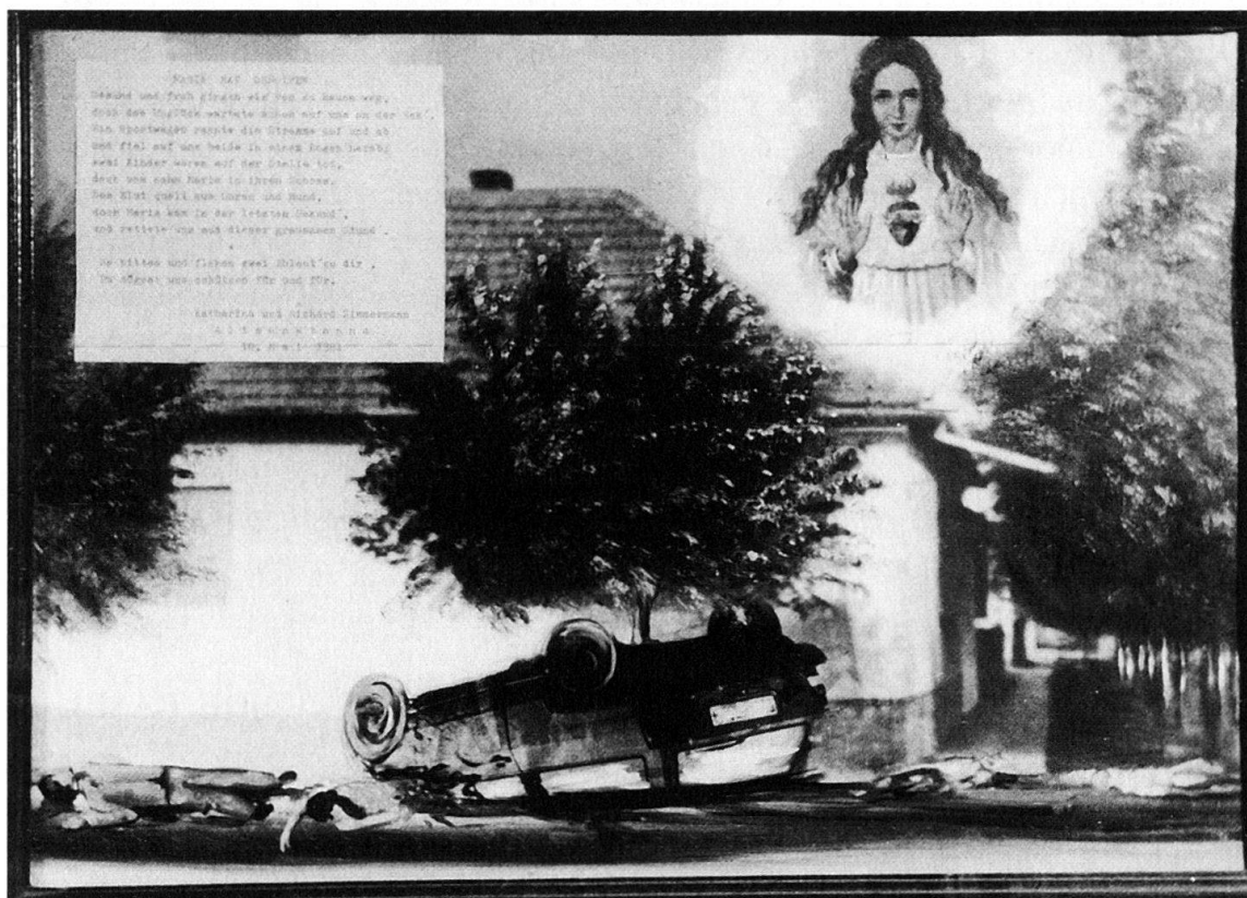
Abb. 9: Votivbild aus Sankt Anna (Autounfall 1981) mit maschinengeschriebenen Text.