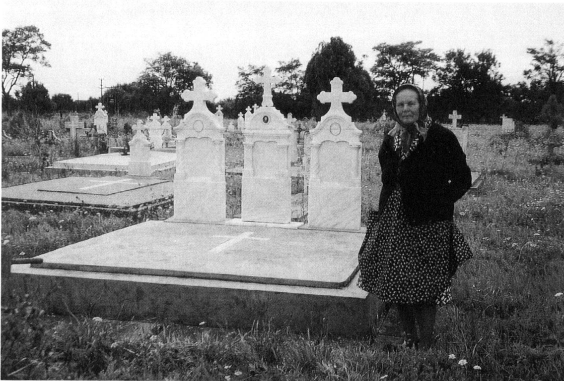
Abb. 3: Alte Frau auf dem Friedhof in Fibiš.