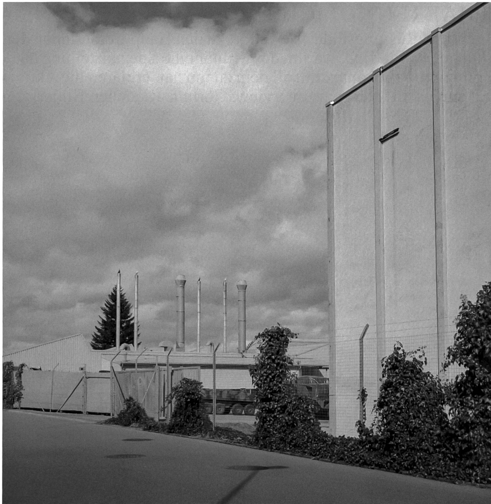
General Dynamics European Land Systems – Mowag GmbH, Kreuzlingen

NK: Anhand der Kampfjets kann man es sich vielleicht besser vorstellen: Die alten FA-18 beispielsweise stossen in einer Stunde 12 Tonnen CO 2 aus. Damit könnte ein Auto zweieinhalb Mal um den Globus fahren. Die neuen Kampfjets, die eine grössere Motorenleistung haben, stossen noch massiv mehr aus.