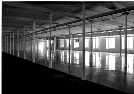
Die Säulenhalle der Flumserie.

Jetzt werden noch die Wohnungen hinzukommen als weitere Etappe, geplant im ältesten Teil, dem Hauptbau von 1864–1866. Die riesigen Hallen, gesamthaft 17'000 Quadratmeter Fläche, stehen zur Zeit leer, die Säuleneinteilung lässt noch die