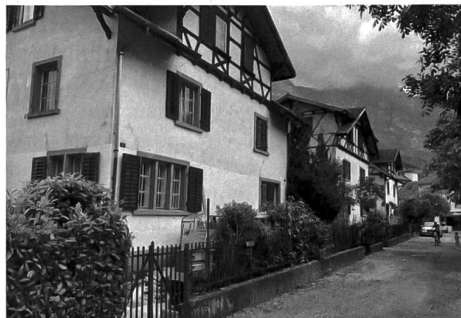
Das Neudorf in Flums.

1900 erstellen als eine Art Gartenstadt für die Fabrikarbeiterinnen und Fabrikarbeiter. Heute ist etwa ein Drittel der Häuser unbewohnbar, drei wurden renoviert, noch in den 90er-Jahren sollte die ganze Siedlung abgebrochen werden. Tempi passati : Heute geniesst das «Neudorf» als eine der bedeutendsten Arbeitersiedlungen der Schweiz gemäss der Eidgenössischen Kommission für Denkmalpflege «Ensembleschutz», und And-